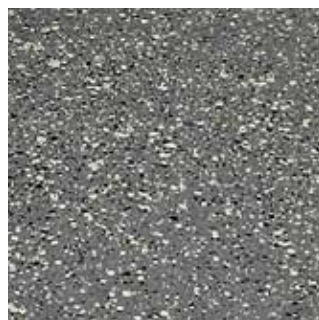
COLOR CODE QPP (magma-tech grigio perla)