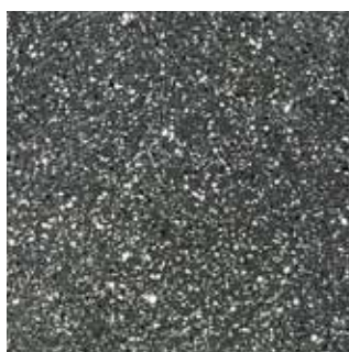
COLOR CODE QGP (magma-tech grigio scuro)