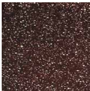
COLOR CODE QRP (magma-tech rosso)