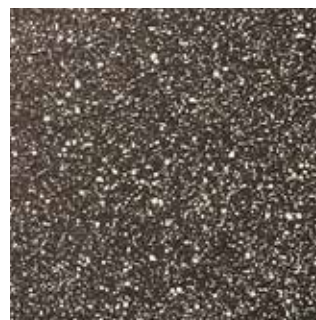
COLOR CODE QMP (magma-tech marrone)