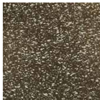
COLOR CODE QOP (magma-tech oro)