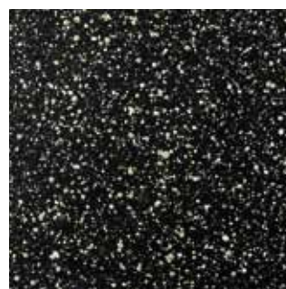
COLOR CODE QOA (magma-tech nero&oro)