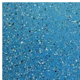
COLOR CODE QPB (magma-tech blu)