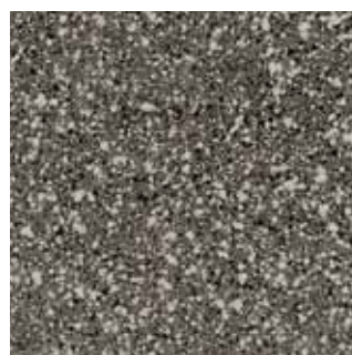
COLOR CODE QGN (magma-tech grigio chiaro)