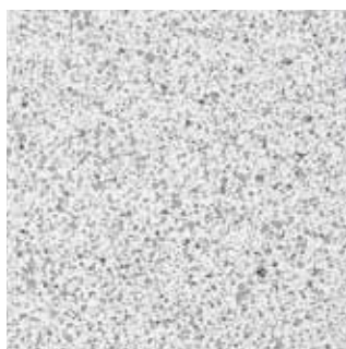
COLOR CODE ETB (magma-tech crema)