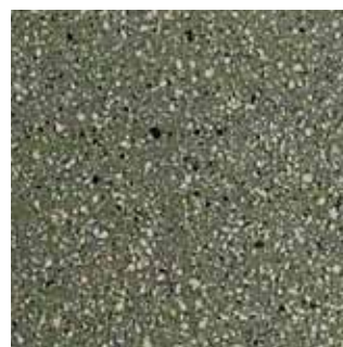
COLOR CODE QVP (magma-tech verde)