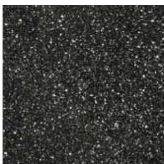
COLOR CODE QUP (magma-tech nero)