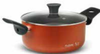
CASSERUOLA 2 M + COP. / DUTCH OVEN 2 H + GLASS LID