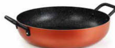
TEGAME 2 MANIGLIE / PAN 2 HANDLES