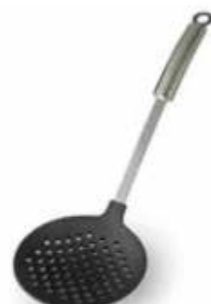
SCHIUMAROLA / SKIMMER