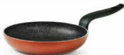
PADELLA / FRYING PAN

The bottom is also provided with a special non-slip finishing, for maximum safety during cooking.