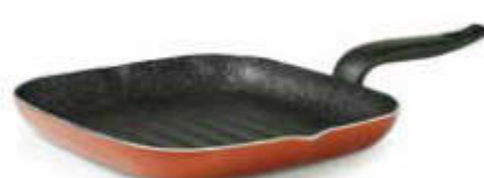
BISTECCHIERA / GRILL PAN