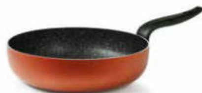
PADELLA EXTRA ALTA / EXTRA DEEP FRYING PAN