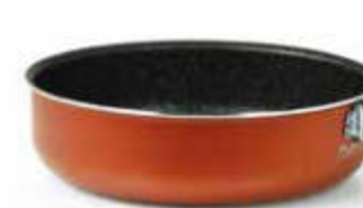
TORTIERA / ROUND BAKING PAN