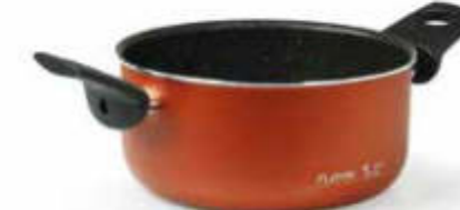
CASSERUOLA DUE MANIGLIE / DUTCH OVEN 2 HANDLES