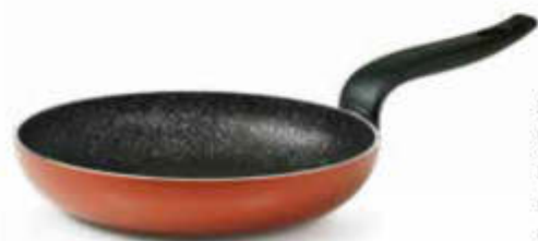
PADELLA / FRYING PAN