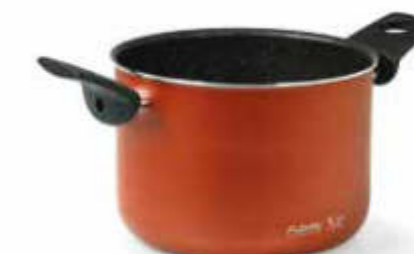
PENTOLA / POT