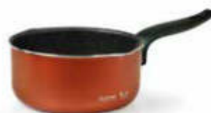
CASSERUOLA 1 MANICO / SAUCEPAN 1 HANDLE