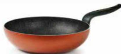
WOK / WOK