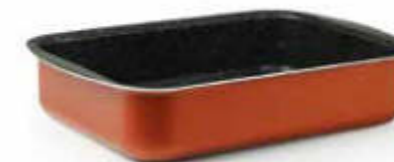
LASAGNERA / RECTANGULAR BAKING PAN