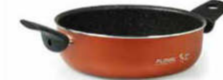
TEGAME 2 MANIGLIE / SAUTEPAN 2 HANDLES