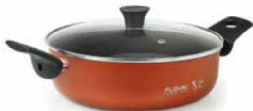
TEGAME 1 M + COP. / SAUTEPAN 2 H + GLASS LID

Designed for everyday cooking, Pepita Granit offers a high-quality non-stick coating which allows you to cook tasty and at the same time healthy dishes, without adding fat. The high thickness of the aluminium guarantees excellent heat distribution during cooking besides a perfect stability of the bottom.